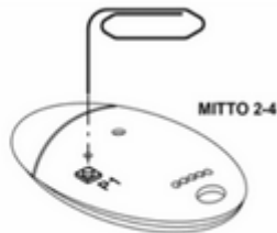
Seno tipo Mitto